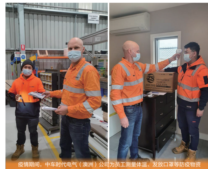
疫情期间，中车时代电气（澳洲）公司为员工测量体温、发放口罩等防疫物资

为将疫情风险降到最低，中国中车第一时间要求派驻澳大利亚和新西兰的海外员工采取居家办公模式，通过邮件、电话会议、视频会议等远程方式履行职能，减少外出频次。