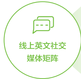
线上英文社交媒体矩阵

中车在澳企业建立大洋洲区域协同工作方案，各企业间实现共享和互助，并与同地区其他合作伙伴与机构保持密切联系。中国中车秉承坦诚透明沟通的理念，通过运营英文社交媒体账号、举办开放日活动、组织员工文体活动等方式，与各利益相关方开展广泛深入的沟通与交流。