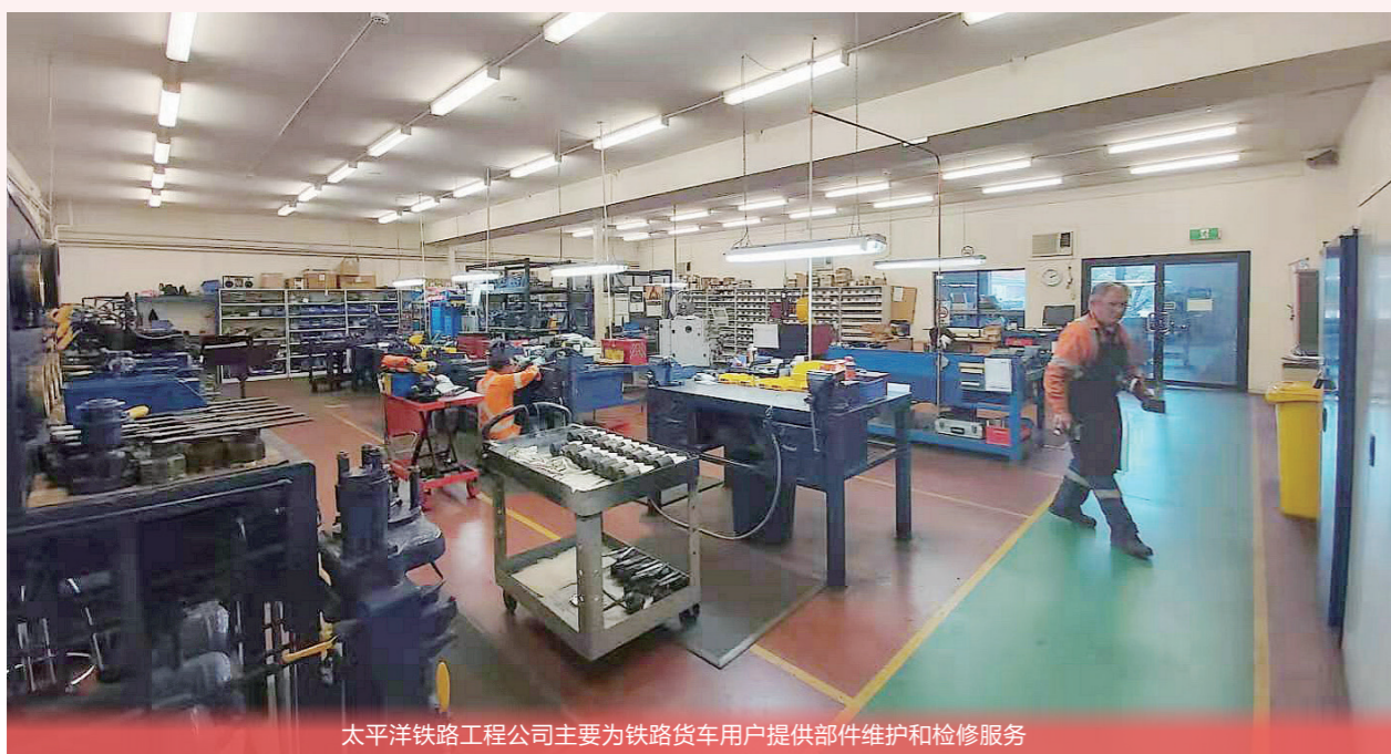
太平洋铁路工程公司主要为铁路货车用户提供部件维护和检修服务