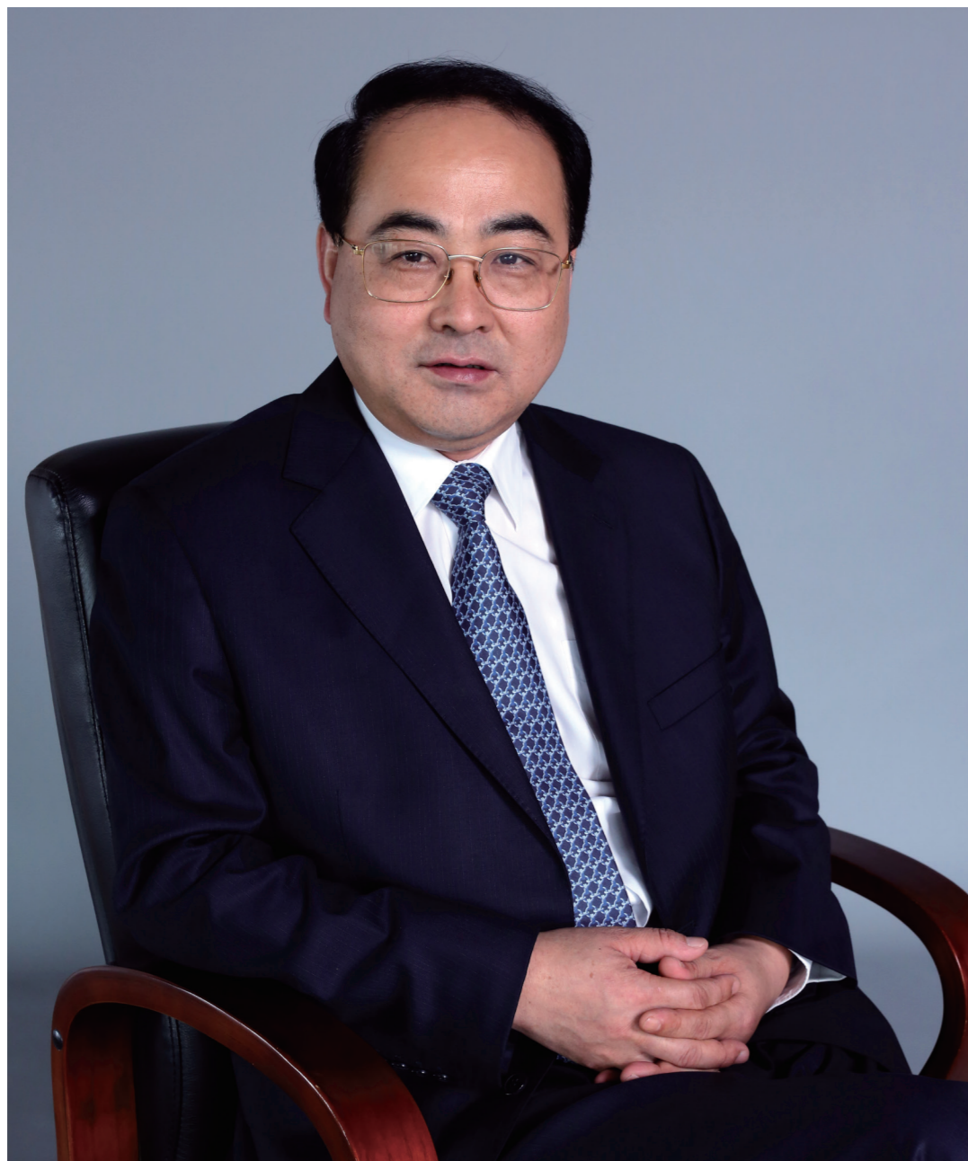
中国中车集团有限公司董事长：孙永才