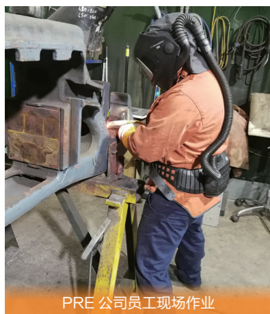
PRE 公司员工现场作业

中车时代电气（澳洲）公司将安全确定为公司优先价值观，保护员工安全与业务所在地环境安全。我们相信，一切安全事故都可避免，安全是每个人的责任，领导者的行为可对安全问题产生影响，任何人都可阻止不安全行为，要求员工和承包商承担应有的安全责任，公司可通过学习改进安全管理。