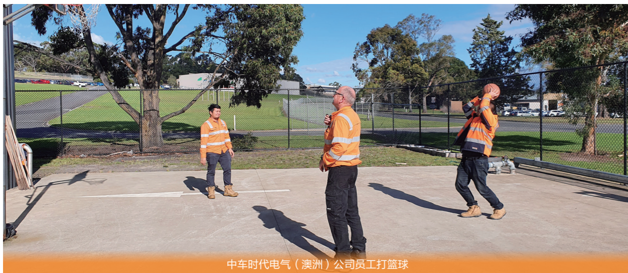
中车时代电气（澳洲）公司员工打篮球