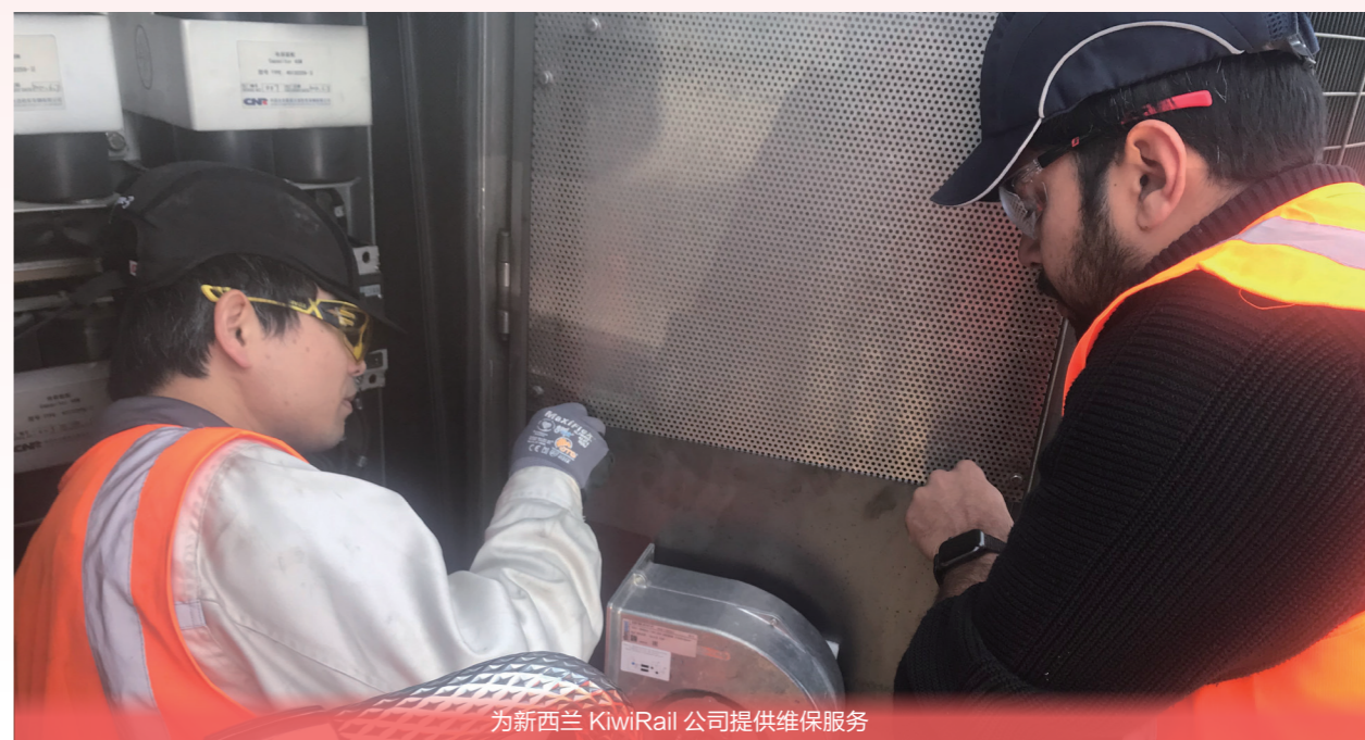
为新西兰 KiwiRail 公司提供维保服务