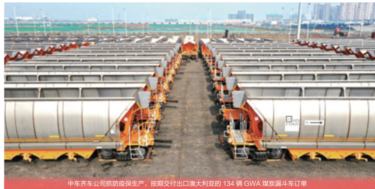
中车齐车公司抓防疫保生产，按期交付出口澳大利亚的 134 辆 GWA 煤炭漏斗车订单

2020 年，中车齐车公司先后获得了 FMG 公司 252 辆矿石车订单、ITS 公司 74 辆 DQMY 型集装箱平车及 60 辆 DQHY 型集装箱平车订单、必和必拓公司 390 辆矿石车意向函。截至 2021 年 5 月底，中车齐车公司已累计向澳大利亚提供近 1.7 万辆铁路货车。