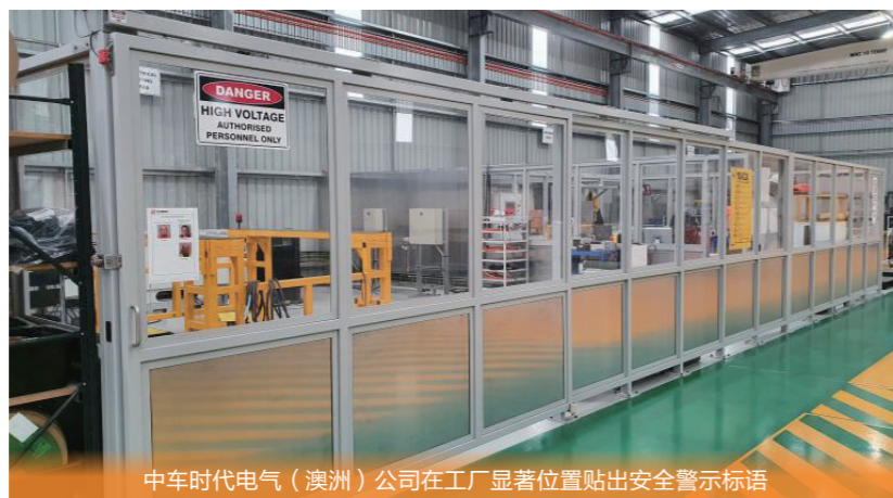
中车时代电气（澳洲）公司在工厂显著位置贴出安全警示标语